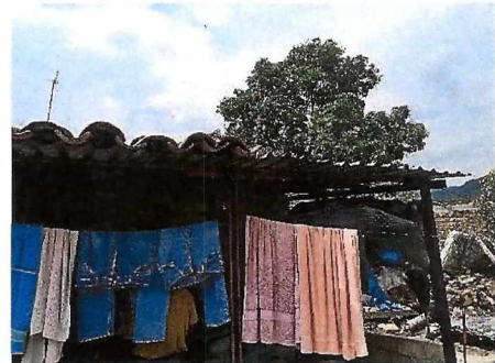
Techumbre de teja