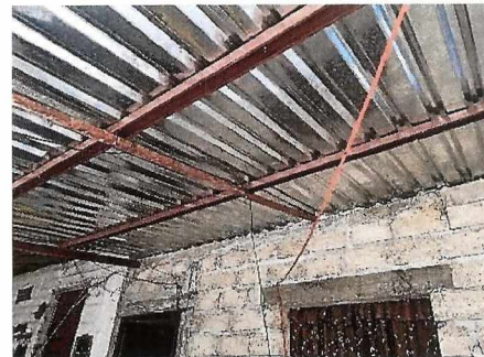
Techumbre de lámina galvanizada