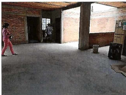
Piso de concreto F'C=250KG/CM2 en bodega

Así mismo a esta verificación, una vez realizada se presenta para fines prácticos una muestra de la memoria fotográfica de los diferentes implementos los cuales se describen a continuación: