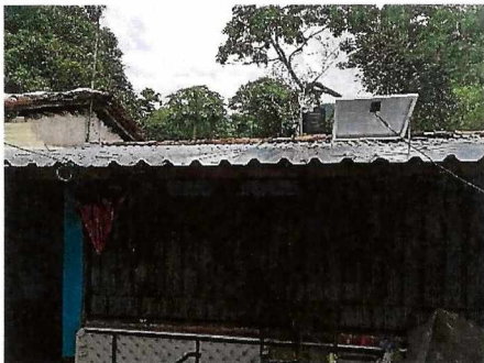
Techumbre de lamina galvanizada