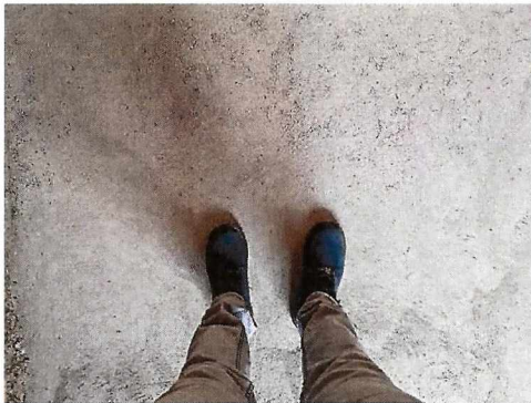
Piso colado de concreto

Ejecutor: Secretaría de Agricultura y Desarrollo Rural (SADER-JALISCO)