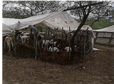
Corral para cabras