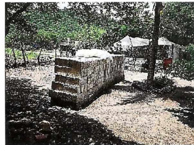
Material, Block y Viguetas