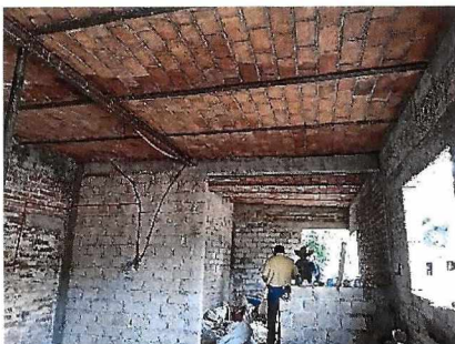
Losa en casa afectada