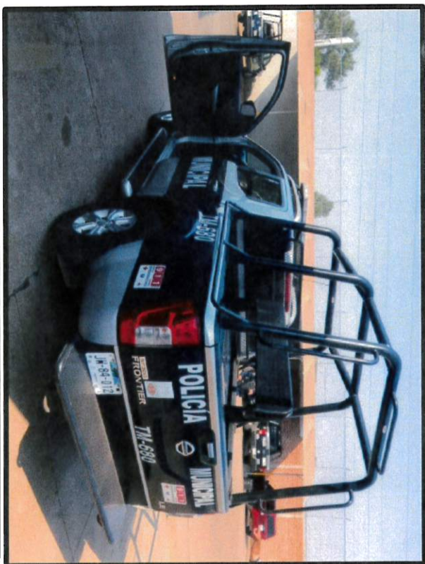
Vehículos pick up para la Comisaría de Seguridad Pública.