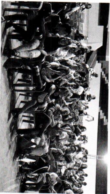
Eventos de Danza Clásica y música en kiosko de plaza principal.