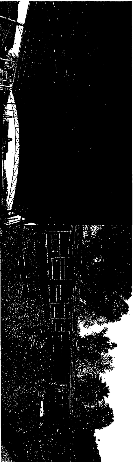
"Trabajos de mantenimiento en salones y construcción de techumbre en cancha de usos múltiples dentro de la misma Escuela"

Derivado de la verificación física que se realizó el día 16 de mayo de 2018 al sitio de los trabajos, por parte del personal de este Órgano Estatal de Control en conjunto con el personal del H. Ayuntamiento de Cuquío, Jalisco, se determinó que la obra denominada "Rehabilitación de escuela y construcción de techumbre en la Secundaria Federal 64, ubicada entre Calle Mariano Jiménez y Ejido, aun costado del Centro de Salud, en la cabecera Municipal", se encuentra terminada y operando adecuadamente, cumpliendo con las metas del proyecto; tal como se muestra a continuación: