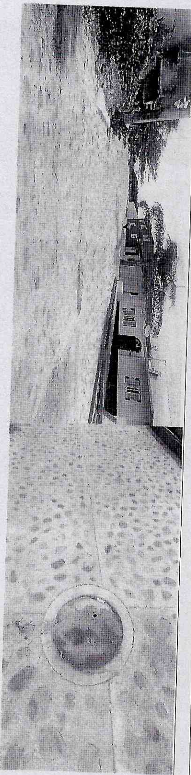
Construcción de red de drenaje en la calle ingreso