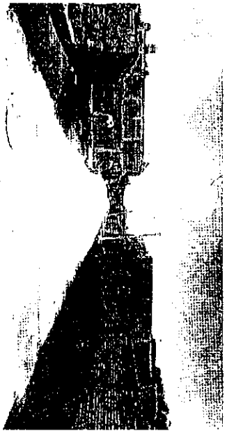
Pavimentación con concreto hidráulico de calle Ocampo en la col. López Mateos.