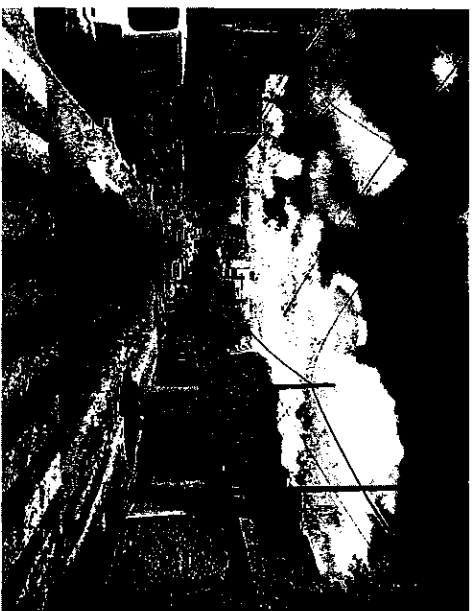
"Se observa pavimento y banquetas".

Sin embargo, los resultados de la auditoría indican que en la operación y ejercicio de los recursos del Programa de Infraestructura (Vertiente Infraestructura para el Hábitat y Vertiente Espacios Públicos y Participación Comunitaria), ejercicio fiscal 2017, a cargo del H. Ayuntamiento de Guadalajara, Jalisco, no cumplió íntegramente con las disposiciones normativas que lo regulan y la legislación en materia de obra pública, por lo que esta auditoría tiene como resultado 02 (dos) Cédulas de Observación, resultantes de la revisión documental, para la obra antes referida.