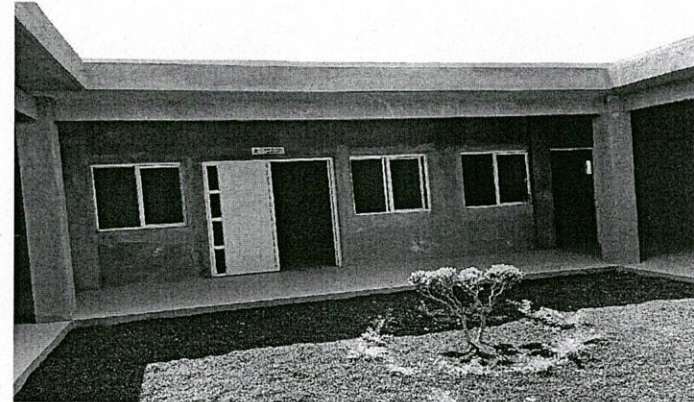
"Vista exterior e interior del Centro comunitario".