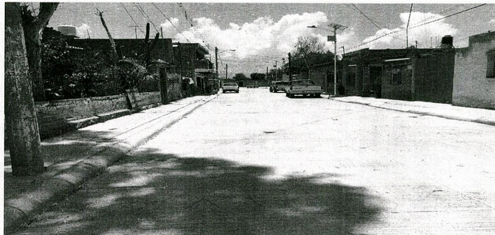
"Vista de los trabajos de pavimento hidráulico, machuelos y banquetas, realizados en la obra".

N°1 "Readecuación de construcción de pavimento hidráulico en la calle Fray Juan de Zumárraga y Privada de Las Rosas".