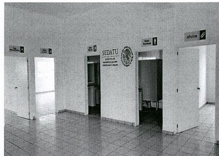
“Construcción de Centro de Desarrollo Comunitario Camino Real”.