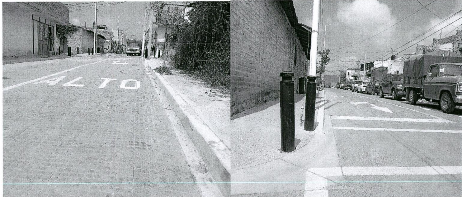
"Se observan trabajos de pavimento, machuelo y banquetas de concreto hidráulico, balizamiento y bolardos en calle Abasolo, en Tlajomulco de Zúñiga, Jal."

➤ Obra revisada al 100 %: Readequación de la calle Abasolo, incluye: construcción de red de agua potable, alcantarillado sanitario, banquetas y alumbrado público en la cabecera municipal, municipio de Tlajomulco De Zúñiga, Jalisco.